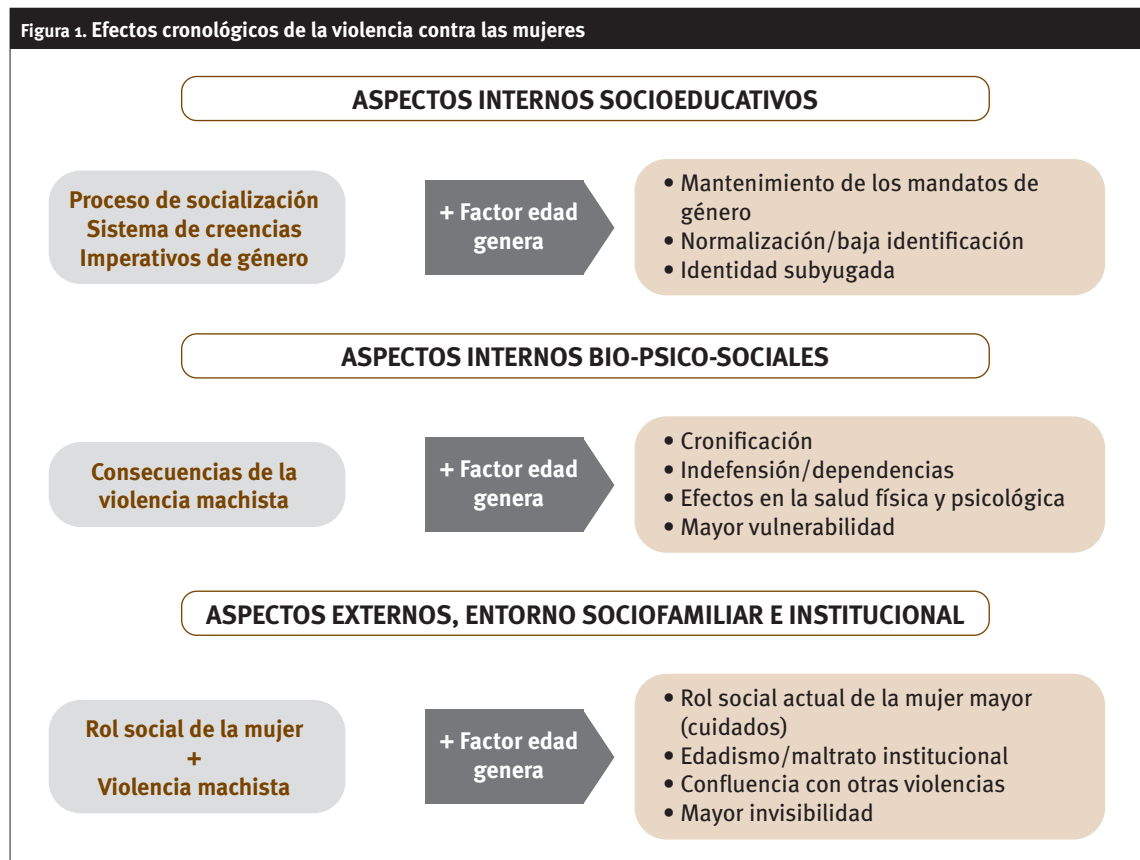
Figura 1. Efectos cronológicos de la violencia contra las mujeres

Las mujeres que nacieron en la primera mitad del siglo pasado construyeron su identidad en un contexto en el que el sometimiento, el control y la humillación hacia las mujeres, por parte de los hombres, era algo normalizado, no sorprendía; eran situaciones legitimadas sobre las que la sociedad no intervenía, más bien todo lo contrario: se imponía desde diferentes agentes socializadores. La infantilización de las mujeres fue un proceso normalizador; incluso los varones adolescentes podían tener más ascendencia en la toma de decisiones familiares que la madre. Esta normalización ha favorecido que la víctima no se identifique como tal, generando con el paso del tiempo mayor normalización y cronificación.