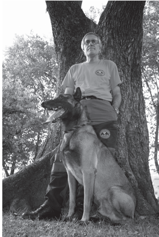
Un equipo del Grupo del Perro de Salvamento de Euskadi, formado por un voluntario y su perro.

Éstos son sólo tres ejemplos de las numerosas acciones de voluntariado desarrolladas en la CAPV, que muestran que la actividad voluntaria ofrece enormes satisfacciones, pero también requiere esfuerzo y compromiso. A fin de no perder voluntariado y conseguir a más personas que quieran colaborar con ellas, las organizaciones deben identificar nuevas fórmulas de captación y seguimiento, que estén bien organizadas y sigan un proceso estructurado. En lo referente a la sensibilización, es importante que las entidades cuenten con una persona encargada de comunicación, que planifique adecuadamente la estrategia, para poder llegar a la sociedad y al voluntariado potencial.