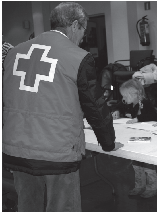
Voluntario de la Cruz Roja en una actividad con niños y niñas.

El voluntariado de acompañamiento puede vivir situaciones muy diversas, asistiendo a personas que no pueden hablar debido a que tienen parálisis cerebral, a personas que necesitan ayuda para poder moverse o a otras que no tienen a nadie con quien compartir una conversación. Esas dos horas que pasan con el voluntariado son muy valiosas para las